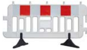
ZAPORA DROGOWA (BARIERKA)