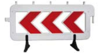
ZAPORA DROGOWA (BARIERKA)

Tablica prowadząca U-3 wykonana z polietylenu do uprzedzania kierującego pojazdem o koniecznej zmianie kierunku jazdy. Strzałki z folii odblaskowej.