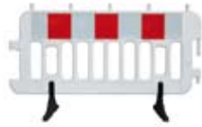
ZAPORA DROGOWA (BARIERKA)

Zapora drogowa z nóżkami (barierka) wykonana z polietylenu do wygradzania miejsc robót prowadzonych w pasie drogowym. Lica z folii odblaskowej.