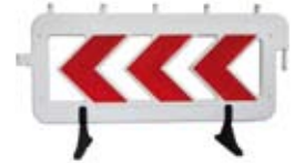
ZAPORA DROGOWA (BARIERKA)

Tablica prowadząca U-3 wykonana z polietylenu do uprzedzania kierującego pojazdem o koniecznej zmianie kierunku jazdy. Strzałki z folii odblaskowej.