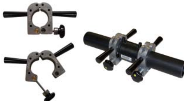
ZAKRAGLACZE DO RUR PE TYP C