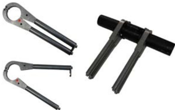
ZAKRAGLACZE DO RUR PE TYP B