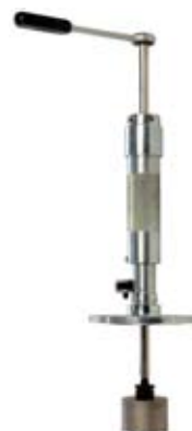
PRZYRZĄD DO NAWIERCANIA RUR PE PRZEZ KSZTAŁTKI SIODŁOWE Z KOŁNIERZEM