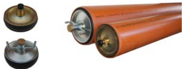
KORKI DO ZASLEPIANIA RUR PVC