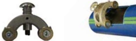
PRZYRZĄD DO ZDJEMOWANIA PŁASZCZA OCHRONNEGO PP

Przyrząd do zdejmowania płaszcza ochronnego PP z rur PE100RC