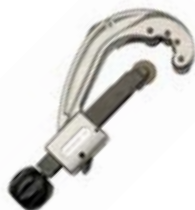
OBCINARKI ROLKOWE DO RUR PE