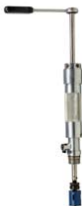
PRZYRZĄD DO NAWIERCANIA RUR PRZEZ KSZTAŁTKI SIODŁOWE Z GWINTEM

Przyrząd do nawiercania pod ciśnieniem W410