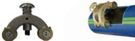
PRZYRZĄD DO ZDJEMOWANIA PŁASZCZA OCHRONNEGO PP

Przyrząd do zdejmowania płaszcza ochronnego PP z rur PE100RC