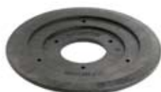
PODSTAWA DO SKRZYNEK ULICZNYCH

Podstawa do skrzynek ulicznych z tworzywa sztucznego