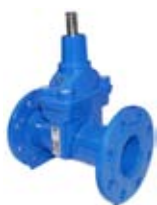
ZASUWA KOŁNIERZOWA DŁUGA

Zasuwa kołnierzowa długa PN16 / PN10 do wody żeliwo sferoidalne