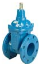
ZASUWA KOŁNIERZOWA KRÓTKA

Zasuwa kołnierzowa krótka PN 16/PN 10 do wody żeliwo sferoidalne