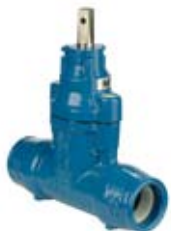
ZASUWA Z KOŃCÓWKAMI ISO

Zasuwa z końcówkami ISO obustronnie z kielichem do rury PE PN16 żeliwo sferoidalne