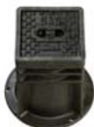
SKRZYNNKA ULICZNA DO ZASUW

Skrzynka uliczna do zasuw do gazu Korpus – tworzywo sztuczne Pokrywa – żeliwo szare