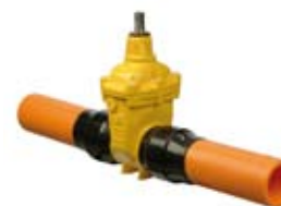
ZASUWA Z KOŃCÓWKAMI PE

Zasuwa z końcówkami PE końcówki PE 100 SDR 11 wymienne uszczelnienie trzcienia PG3 PN 10 żeliwo sferoidalne