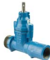
ZASUWA OBUSTRONNIE Z GWINTEM

Zasuwa obustronnie z gwintem oraz kielichem do rury PE, do wykonania przyłącza pod ciśnieniem PN 16 żeliwo sferoidalne BSP1 – gwint wewnętrzny BSP2 – gwint zewnętrzny