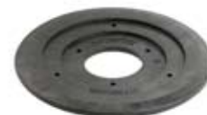
PODSTAWA DO SKRZYNEK ULICZNYCH I HYDRANTU

Podstawa do skrzynek ulicznych i hydrantu z tworzywa sztucznego