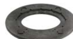
PODSTAWA DO SKRZYNEK HYDRANTOWYCH

Podstawa do skrzynek do zaworów z tworzywa sztucznego