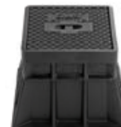
SKRZYNNKA ULICZNA DO ZAWORÓW

Skrzynka uliczna do zaworów Korpus – tworzywo sztuczne Pokrywa – żeliwo szare