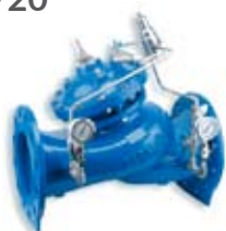
ZAWORY REGULACYJNE 771/720 Bermad

Zawór regulacyjny Bermad przeznaczony do redukcji ciśnienia do wartości zadanej PN 16. Żeliwo sferoidalne