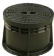
SKRZYŃKA ULICZNA HYDRANTOWA

Skrzynka uliczna do hydrantów Korpus - tworzywo sztuczne Pokrywa - żeliwo szare