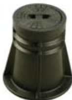
SKRZYNKI ULICZNE DO ZASUW

Skrzynka uliczna do zasuw przyłączeniowych do wody Korpus - tworzywo sztuczne Pokrywa - żeliwo szare