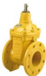
ZASUWA KOŁNIERZOWA KRÓTKA

Zasuwa kołnierzowa krótka wymienne uszczelnienie trzcienia PG3 PN 10/16 żeliwo sferoidalne